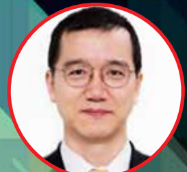
이상제 부원장 금융감독원, 금융소비자보호처장